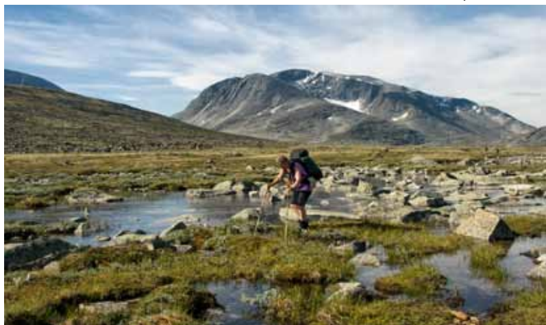
Dovre fjell–Sunndalsfjellan kansallispuisto, Snøhetta.