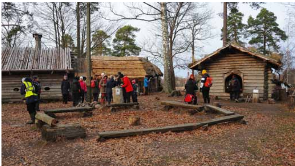
Yhdistyksen pikkujoulu Pukkisaaren rautakautisessa kauppakylässä