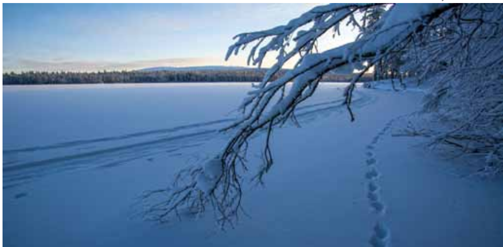
Aakenus-tunturi Kukasjärven takana marraskuussa 2019