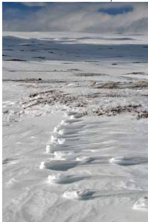
Kova tuuli on pyyhkinyt irtolumet pois, jättäen poron jälkijonon koholle.