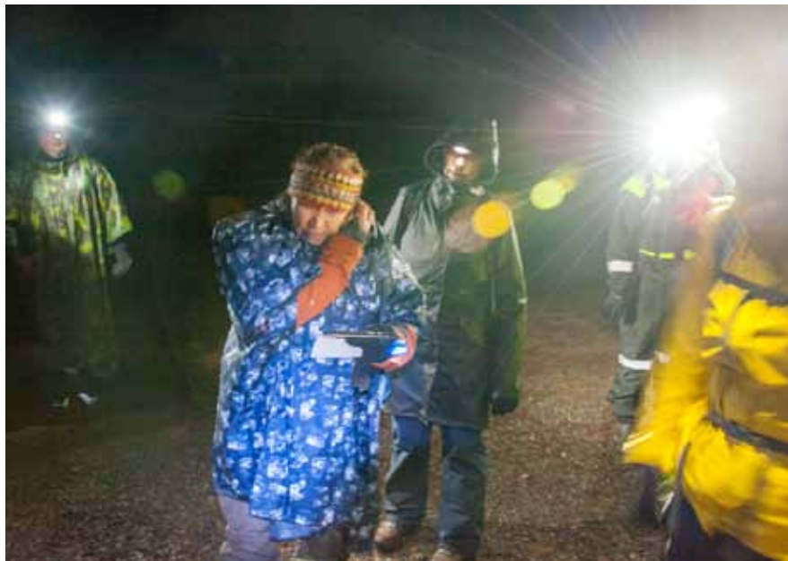
Lähdössä Tasakallion parkkipaikalta