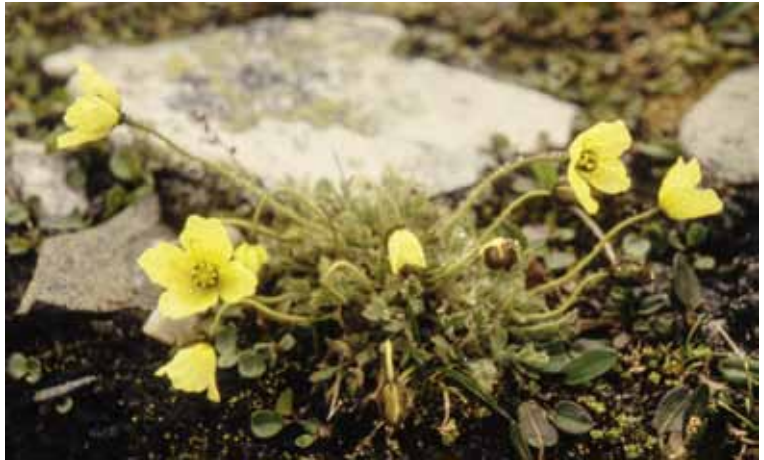
Pälsan eli Laestadiuksen unikko

tella, sitten päätimme lähteä unikkoja etsimään, vaikkei näkyvyys ollutkaan kehuttava. Emme päässeet kulkemaan kuin varttitunnin kun oli puettava sadevaatteet. Rinnettä oli helppo nousta viistoon. Sinirikko kukki runsaana. Harvakseltaan löysimme iturikkoja, pahtarikkoja ja lumirikkoja. Ylempänä kukki soma si-