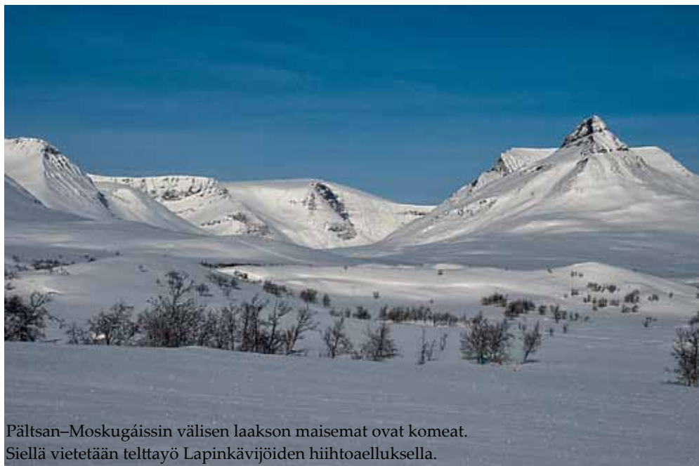
Pältsan–Moskugáissin välisen laakson maisemat ovat komeat. Siellä vietetään telttayö Lapinkävijöiden hiihtoaelluksella.