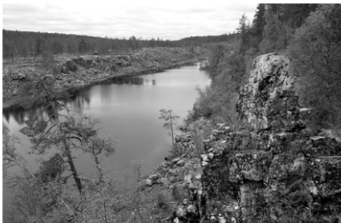
Taatsinseita Kittilän Pokassa on entisaikojen mahtiseita.

Seita oli pyhitetty kulttipaikka, joita löytyy ympäri koko Saamenma-