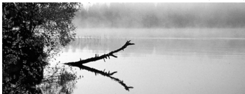
Viikonloppuvaellus Evolla 2004