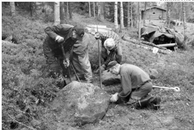
Uuden paikan pohjatyöt aloitettiin välittömästi.