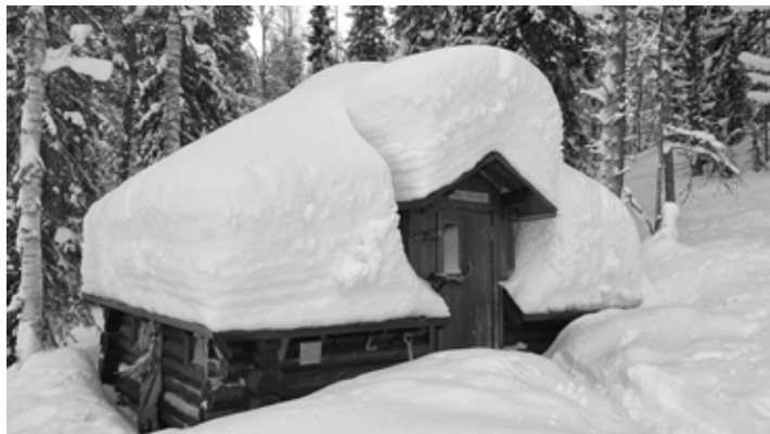
Goadoksen lumikuorma talvihuoltoviikolla