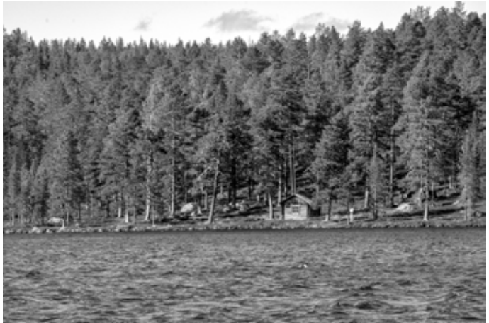
Rautujärvi ja sen päivätupa löytyvät Hammastunturin erämaasta.

Saariselänkävijöitten tuntema Velinsärpimä taas sai nimensä 1930-luvulla. Pokka-Arviiti kävi pula-aikana hakemassa jauhoja Venäjältä, josta poromiehet sitten keittivät vellin eli