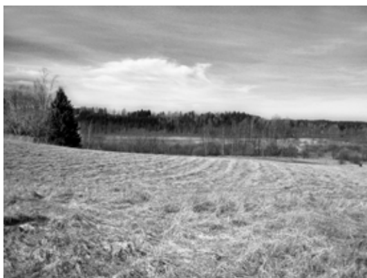
Maisema Tavastkullan vanhalta kylänpaikalta Pikkujärvelle