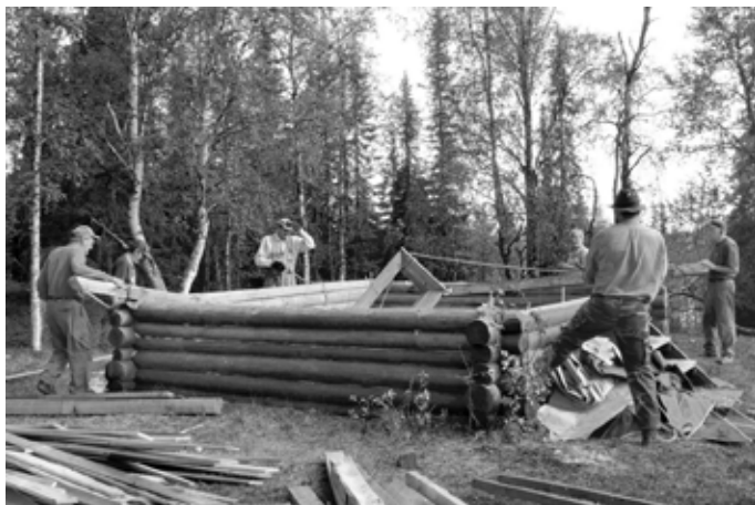
Vieraalla maalla ollut Goados siirrettiin omalle tontille 2007.

paikka Lapissa, omalla maalla, kaikkien jäsenten ja heidän vieraittensa käytettävissä.