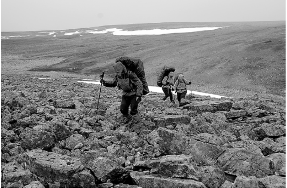
Varanginniemiä on puutonta ja erittäin karua ylänköä.

la rinteellä on vielä heinäkuun alkupuolella lumikenttiä.