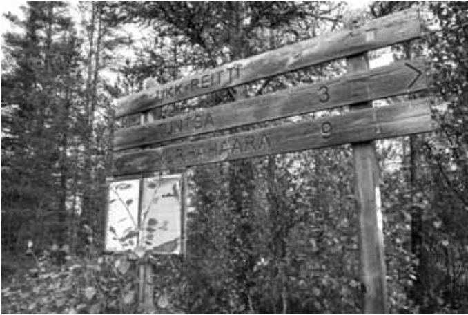
UKK-reitti kulkee halki Tuntsan erämaa-alueen

Aamun valjettua he lähtivät sitten taivaltamaan jokivarretta alas etelää kohti. Kappaleen matkaa kuljetuun tulivat onkamolaiset kuitenkin toisenlaisiin ajatuksiin pohjan suhteen. He hakkasivat kohdalla olleen suvannon jäähän reiän, työnsivät pojan pää edellä avantoon lausuen sanat: "Kon-nasta konna versoo ja konna on myös konnan poika." Siitä lähtien on Värriöjoen itäisintä haaraa kutsuttu Murhahaaraksi.