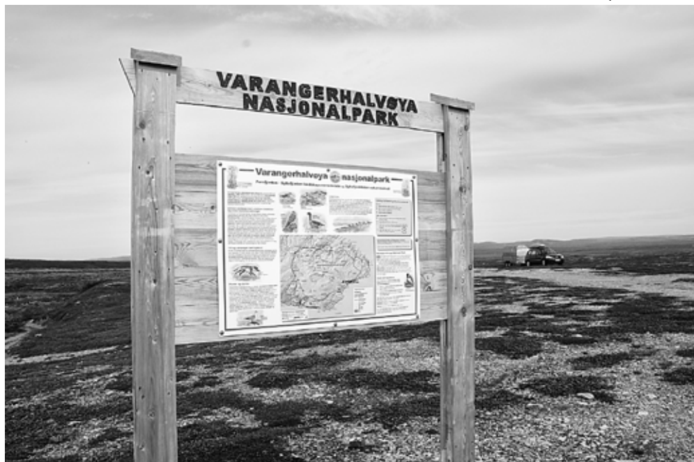
Varanginniemiin kansallispuiston infotaulu.

lä ole koskaan liioittelua. On vain hyvää onnea, jos niitä ei tarvitse käyttää.