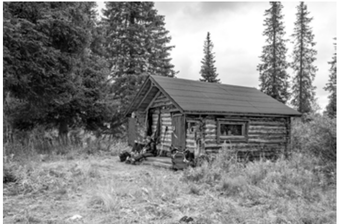
Autiotupa on sympaattinen, mutta sen nimen tarina on synkkä.