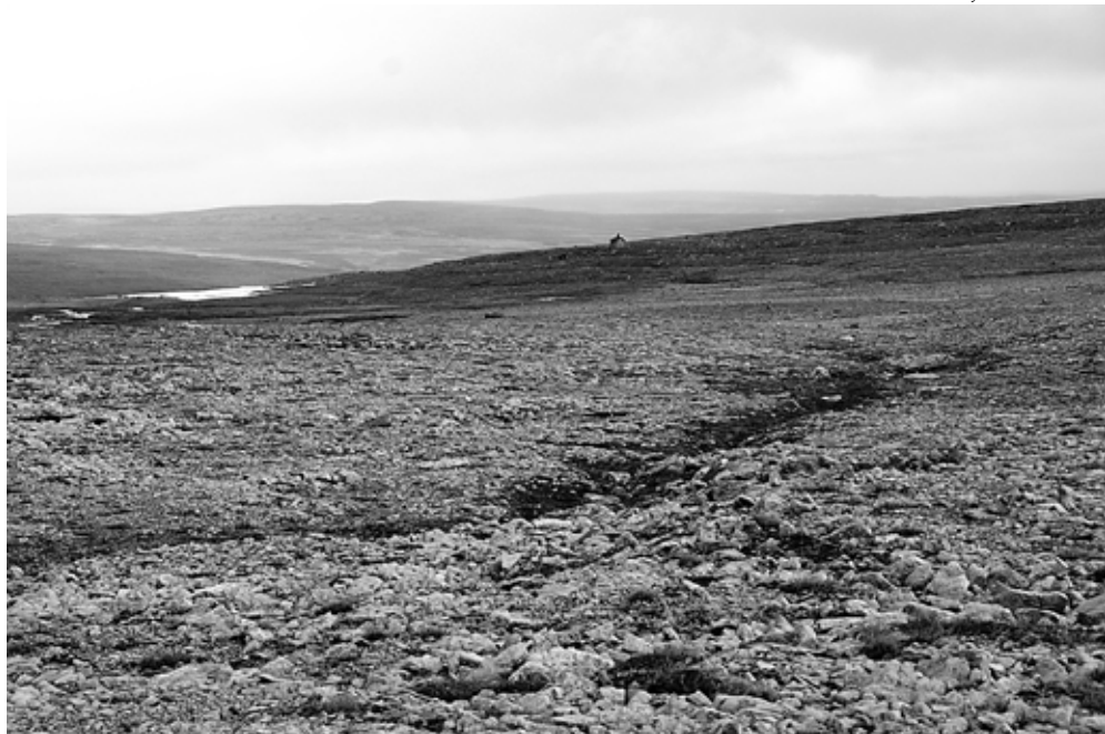
Ragnarokkin tupa näkyy aukean ja lumipeitteen tasoittaman ylängön laidalla.