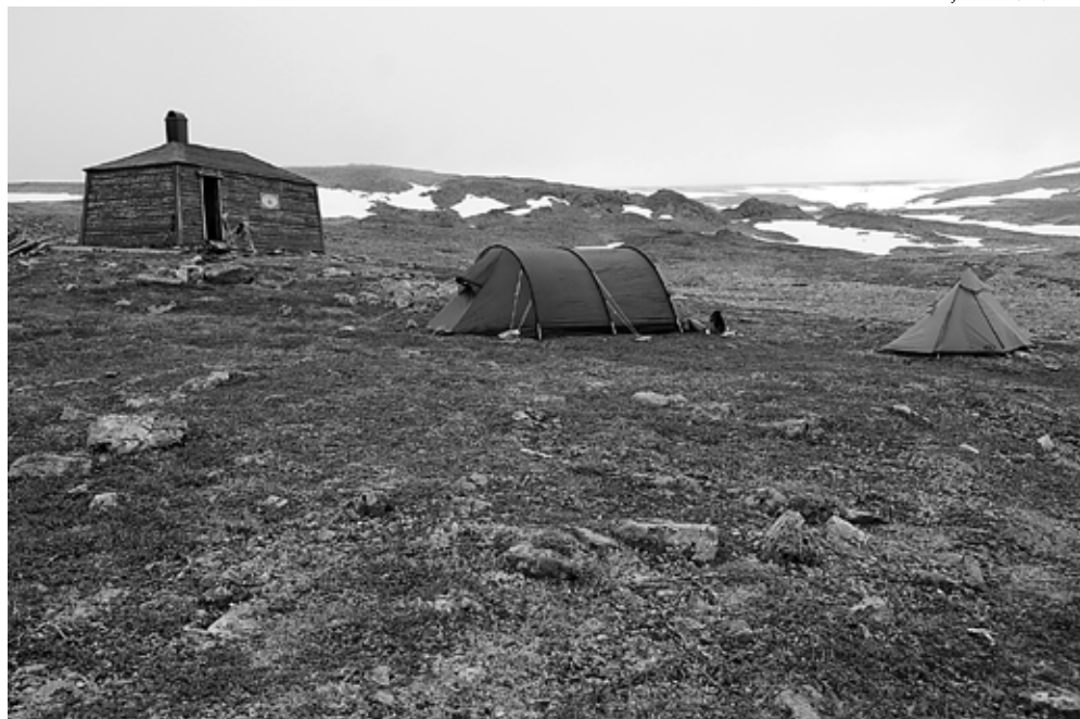
Heimdalin tupa on yksi neljästä kansallispuiston avoimesta tuvasta.