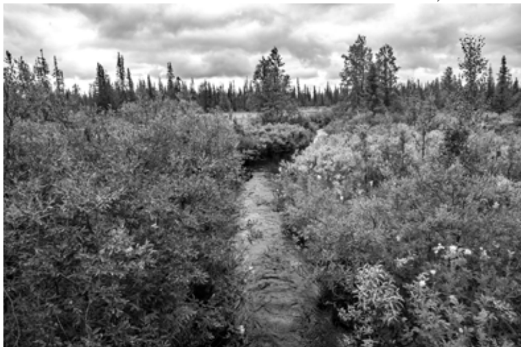
Murhahaaranoja virtaa läpi Murhahaaranaavan suoalueen