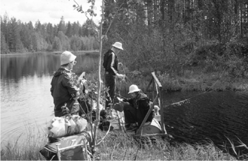
Lutinjoen ylitykseen valmistautuminen

rannalle. Oli pienen tauon paikka läheisellä Saarikosken laavulla. Toinen yllätys odotti retkeläisiä täällä, kun reittiviitan kilometrilukemat osoittivat 100 km Möhköön, vaikka matkailuinfo oli kertonut koko matkan pituudeksi 80 km, ja olimme jo tulleet Suomunjärveltä yli 10 km, joten kilometriarvioihin oli suhtauduttava varauksella.