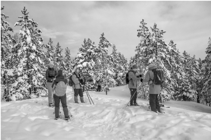
Oppallamme Airilla (keskellä) oli syytä hymyyn.