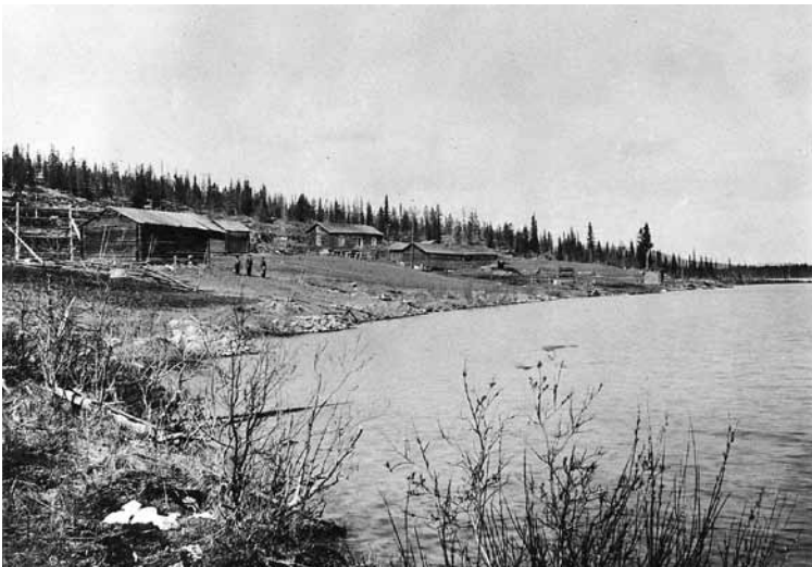
Vettasen tilan kuva 1921

Viitteitä aikaisempienkin vuosisatojen elämään on Kukasjärven maastosta löydetty. Arkeologit ovat paikantaneet järven kaakkoispuo-