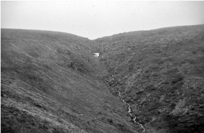
Tiuhtelmakurun ojan yläjuoksua

niskaan. Aikanaan kurukivikkokin loppui ja maisema Muorravaarakajoen laaksoon aukeni. Mieleen tuli heti tarina siitä naisesta, joka päät-