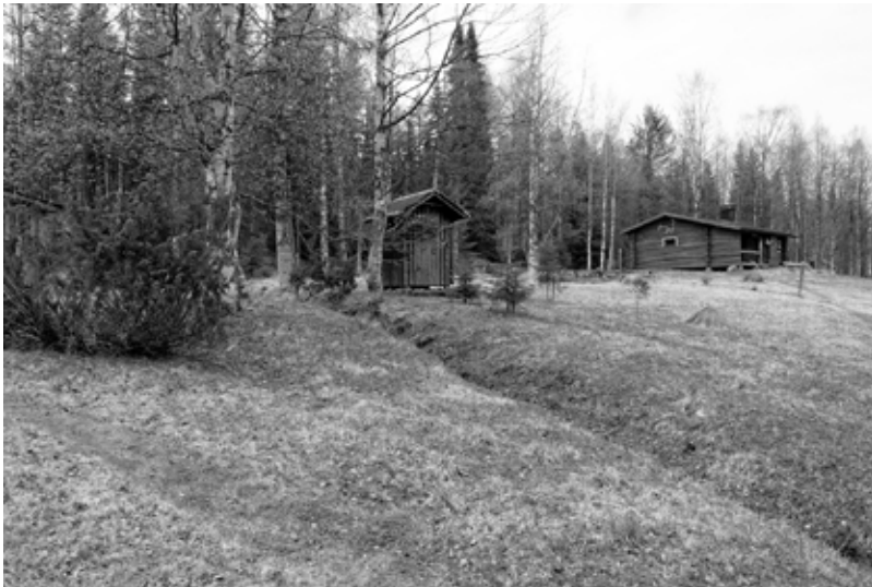
Vettasen tilan vanhat pelto-ojat näkyvät edelleen Kukasjärven pihapiirissä.