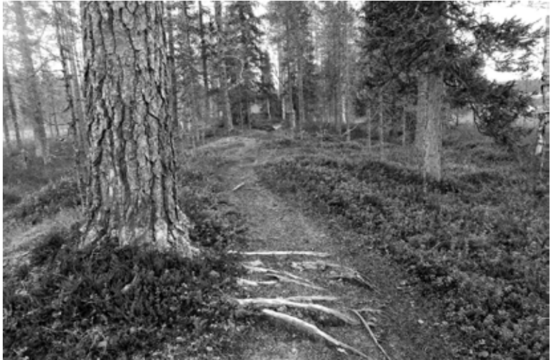
Hossan polut ovat leveitä ja hyväkuntoisia. Tämä polku on osa Hossan pyöräilyreittejä

8-10 henkilöä nukkumaan. Tuvassa on takaseinällä seinästä seinään laveri, kamina nurkassa ja kunnon pöytä penkkeineen. Oli luksusta viettää viimeinen yö kämpässä laavuöiden jälkeen. Tupa oli kylmillään ja sitä lämmittäessämme paistoimme samalla lettuja. Illemmalla tuvalle saapui iso-