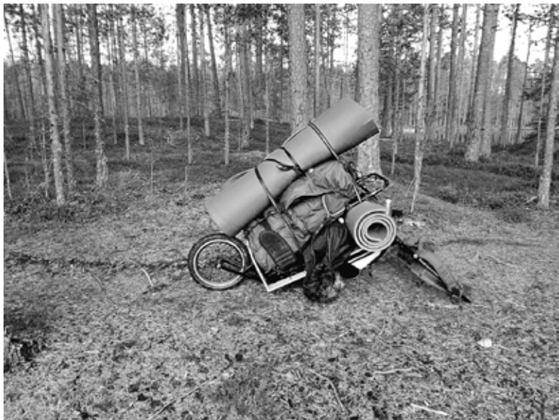
Eräkärri valmiina lähtöön

ja tarjosimme juotavaa sekä syötävää. Lihapyörteen laavulta oli autolle matkaa useampi kilometri mutta urheasti hekin lähtivät paluumatkalta. Meille jäi vähän huolestunut olo. Viime vuosina olemme retkillämme kohdanneet yllättävän monta kertaa kulkijoita, jotka eivät oikein tiedä missä ovat ja ovat aika kevyesti va-