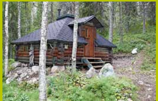
Goados WGS84 67° 42.679' 24° 19.823'