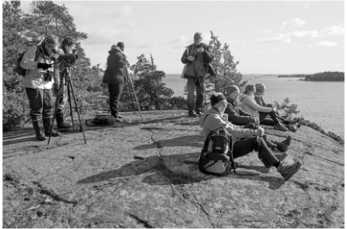
Högbergetin kallioilla nautittiin myös maisemista ja auringon paisteesta.

lijöiden taukopaikka. Ilmassa väreili lämpimän päivän odotus, ja siirryimme viihdyttävän aamustaijauksen jälkeen motelliin aamupalalle.