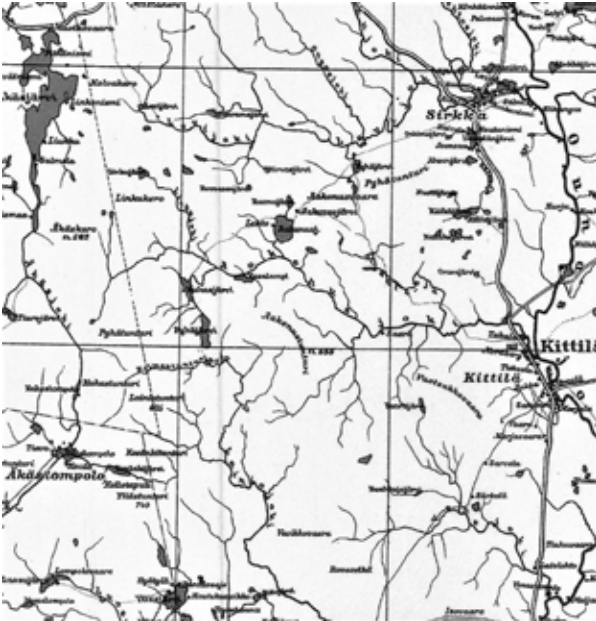
Kartassa vuodelta 1927 näkyy polku Kukasjärveltä Sirkkaan.

jonoa myöten Rauhalaan tai Muotkavaaraan niin on kysymyksessä reitti, jota vertaista suurenmoisuudessaan ja koskemattoman luonnon jylhyydessä, joka sitä paitsi asutukseltakin on rauhoitettu, ei maassamme missään ole.”