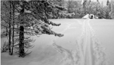
Goados alkuperäisellä paikalla 1991

• Lapinkävijäyhdistys Kiehisten maja 1991