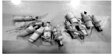
Melkein valmiita sytytyspaloja

Kasta varovasti sulaan kynttilämasaan. Anna sytytyspalojen jäähtyä