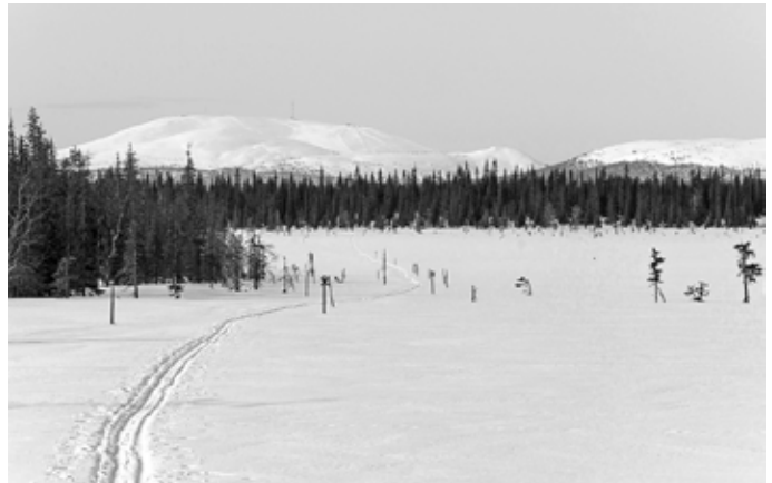
Ylläksen ja Lainion jylhät tunturit.