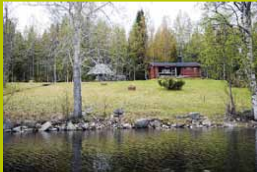
Kukasmaja WGS84 67° 42.708' 24° 19.830'