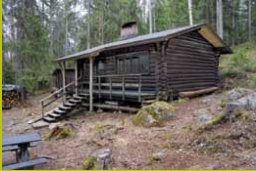
Karjakaivon alamaja WGS84 60° 17.911' 24° 35.090'