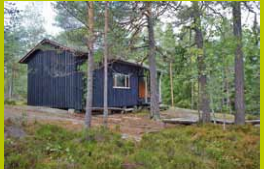
Karjakaivon ylämaja WGS84 60° 17.873' 24° 35.004'