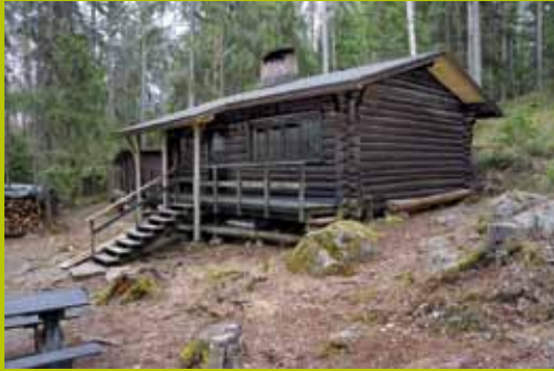
Karjakaivon alamaja WGS84 60° 17.911' 24° 35.090'