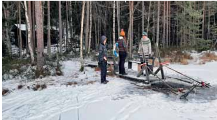
Avanto hyvin merkittynä.

Karjakaivolla meitä odotti lämmin tupa, valmiiksi lämmitetty sauna ja hieno avanto. Osa porukasta saunoi ja rohkeimmat menivät avantoonkin,