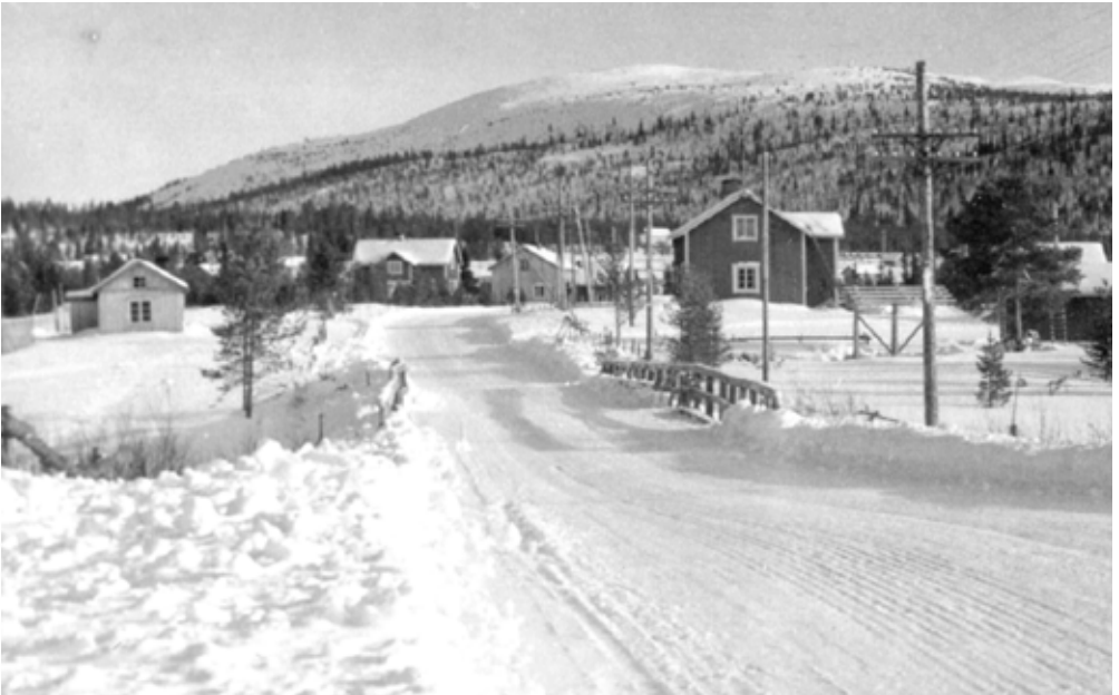
Sirkan kylämaisemaa 1960-luvun alussa

Yleensä turistien käyttöön varattiin perheissä melkein kaikki huoneet. Isäntäväelle jätettiin korkeintaan yh- si huone; muutamassa talossa isän-