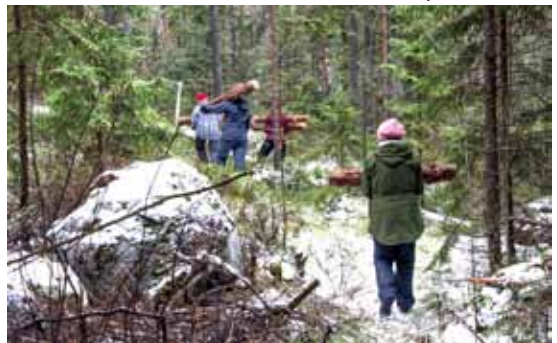
Hankala maasto ei ollut este halkojen siirtämiselle puurotalkoissa.