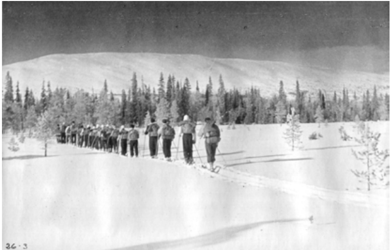
SFS:n hiihtokurssilaisia matkalla Sirkasta Aakenukselle vuonna 1937

Sirkankylään ensimmäiset tunturihiihtäjät toi ruotsinkielinen hiihtoseura Svenska Finlands Skidförbund (SFS). Se alkoi järjestää hiihtokursseja Levin Lammaskurussa vuonna 1936 ja toiminta jatkui vuoteen 1941. Kunnakin keväänä järjestettiin kolmesta neljään kurssia, ja yhteensä kurseille ja majoitukseen tuli tuona aikana