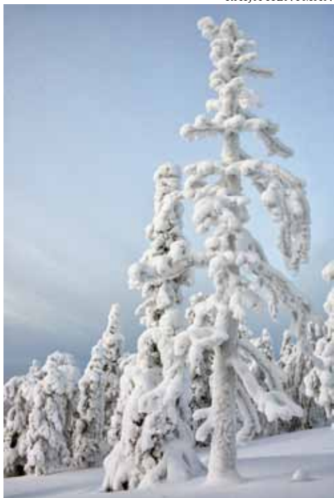
Huurretta ja tykkyä puissa