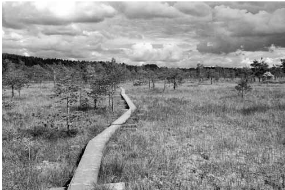
Linnaistensuon levollista maisemaa.

suokohde. Virallinen parkkipaikka on polun länsipäässä, mutta kyllä auton itäpuolellekin saa. Polun pätkät kummassakin päässä edeltävät pitkospuita, jotka halkovat suota.