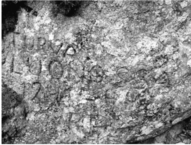
Turva luonnossa 1941 – 44 RH.

olettaa tässä vaiheessa piiloutujankin palanneen kotipiiriinsä.