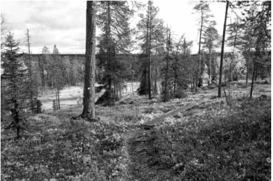
Polku Sallan kansallispuistossa