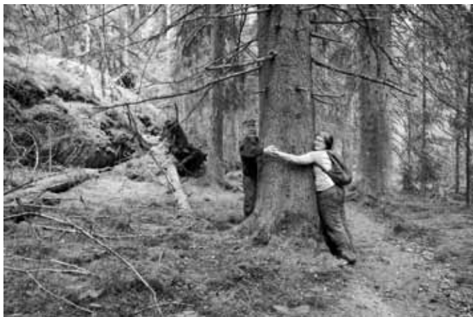
Pesäkallion upealla luonnonsuojelualueen kuusivanhuksilla on kokoa.

Suojelualueen eteläosan ja Merrasjärven ympäristön erityyppiset lehdot ovat erityisen arvokkaita. Pesäkallion polulta palatessa voi ulkoiluteiden risteyksestä suunnata Holmaan päin ja poiketa ison opastaulun luota Merrasjärveä kiertävälle merkittömälle polulle. Järven etelänurkasta alkaa merkittömätön pitkospuureitti, joka haarautuu Mukkulaa kohti vieväksi reitiksi ja Merrasjärven rantaa myötäväksi lankkupolukseksi. Rantaan on rakennettu taukopaikaksi laituri, jota ei ole tarkoitettu uimiseen, mutta järvi-maiseman äärellä on hyvä taukopaikka.