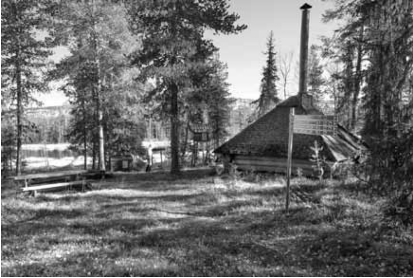
Pitkälammen kota Sallassa