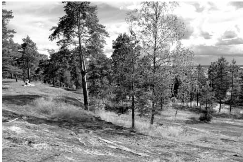
Mustankallionmäellä juhlittiin ennen helavalkeiden äärellä.