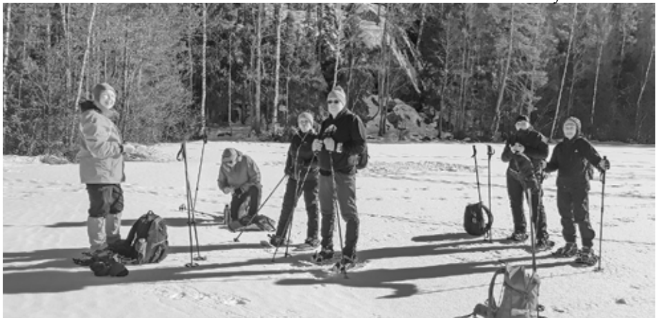
Lumikenkäilijät Piilolammen jäällä Usmin retkellä.