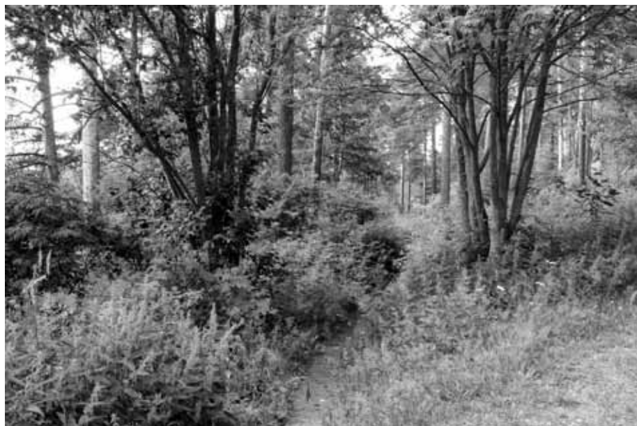
Vesitorninmäellä polku kulkee kuin vihreässä tunnelissa.

On luontevaa tutustua ensin Radiomäkeen, jonka korkeat mastot ovat olleet Lahden tunnus jo vuodesta 1927. Reitti mastoilta koukkaa kaupungintalon puistikon kautta ja matkalla voi piipahtaa myös Radio- ja TV-