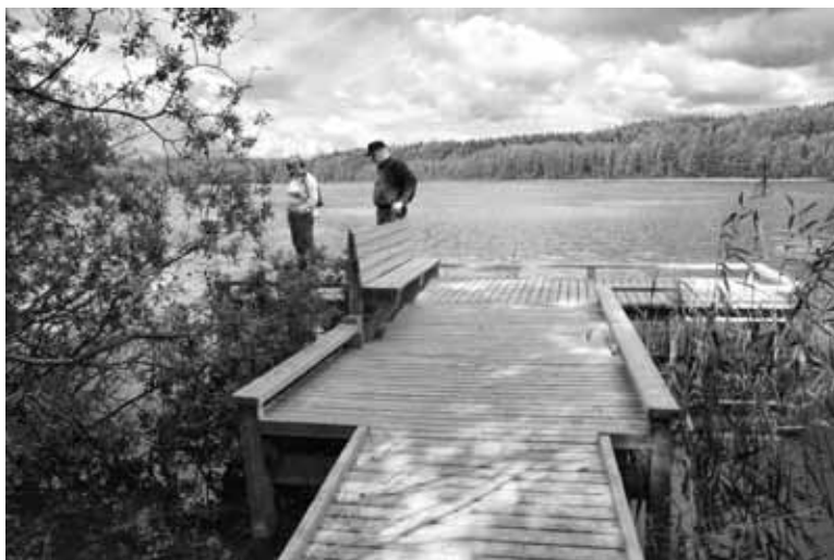
Merrasjärven levähdyslaiturilla voi ihailla maisemia, mutta uimaranta on järven pohjoispäässä.

Suojelualueen eteläosan ja Merrasjärven ympäristön erityyppiset lehdot ovat erityisen arvokkaita. Pesäkallion polulta palatessa voi ulkoiluteiden risteyksestä suunnata Holmaan päin ja poiketa ison opastaulun luota Merrasjärveä kiertävälle merkittömälle polulle. Järven etelänurkasta alkaa merkittömätön pitkospuureitti, joka haarautuu Mukkulaa kohti vieväksi reitiksi ja Merrasjärven rantaa myötäväksi lankkupolukseksi. Rantaan on rakennettu taukopaikaksi laituri, jota ei ole tarkoitettu uimiseen, mutta järvi-maiseman äärellä on hyvä taukopaikka.