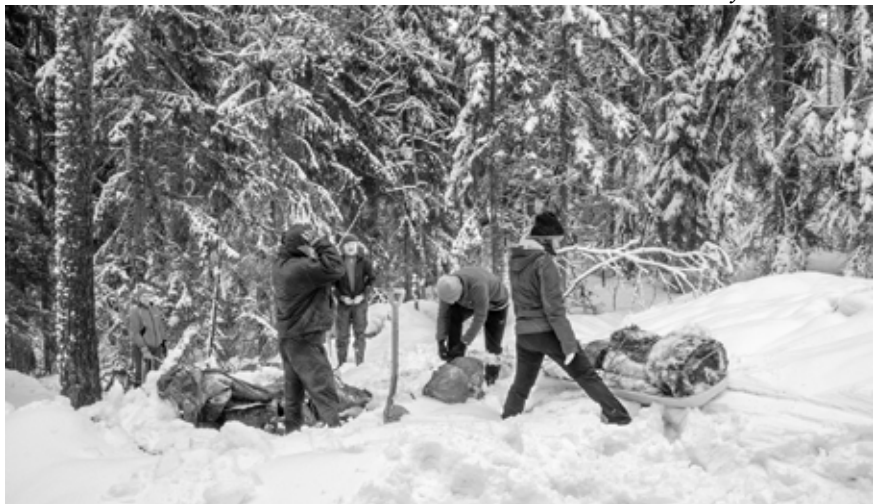
Helmikuun puutalkoissa lunta riitti, eikä se kantanut.