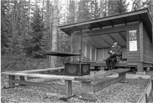
Fiskträskin uusi laavu.

laavu sijaitsee Fiskträskin rannalla. Fiskträskin kierroksen rengasreittiä voi lähestyä joko Bakunskärren tai Korvenportin parkkipaikalta. Yhdysreitit ovat samanmittaiset, mutta Bakunskärren yhdysreitti on metsä-autotietä ja Korvenportin metsäpolkua. Fiskträskin palvelurakenteisiin kuuluvat myös keittokatos, käymälä ja liiteri. Myös telttailu on sallittua. (RH)