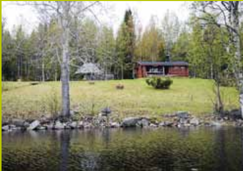
Kukasmaja WGS84 67° 42.708' 24° 19.830'