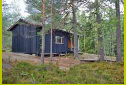
Karjakaivon ylämaja WGS84 60° 17.873' 24° 35.004'