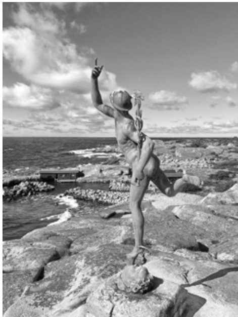
Hermes-jumalan patsas Källskärillä