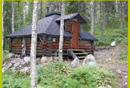
Goados WGS84 67° 42.679' 24° 19.823'

Nuuksio, Käkilampi 4.12.2020