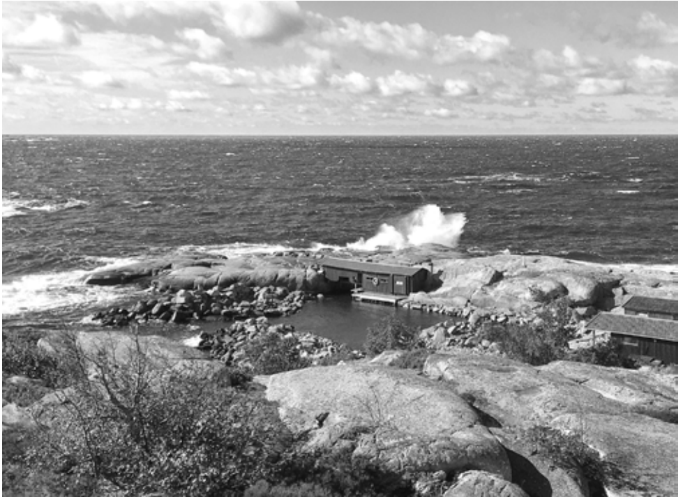
Källskärin rantarakennukset tyrskyineen