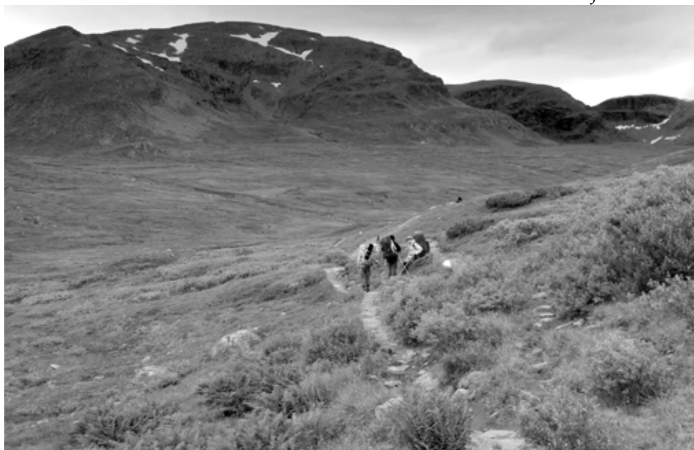
Jääkausi höyläsi laajan U-laakson Norra ja Södra Sytertoppenin korkeiden tuntureiden väliin.