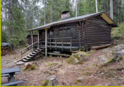
Karjakaivon alamaja WGS84 60° 17.911' 24° 35.090'