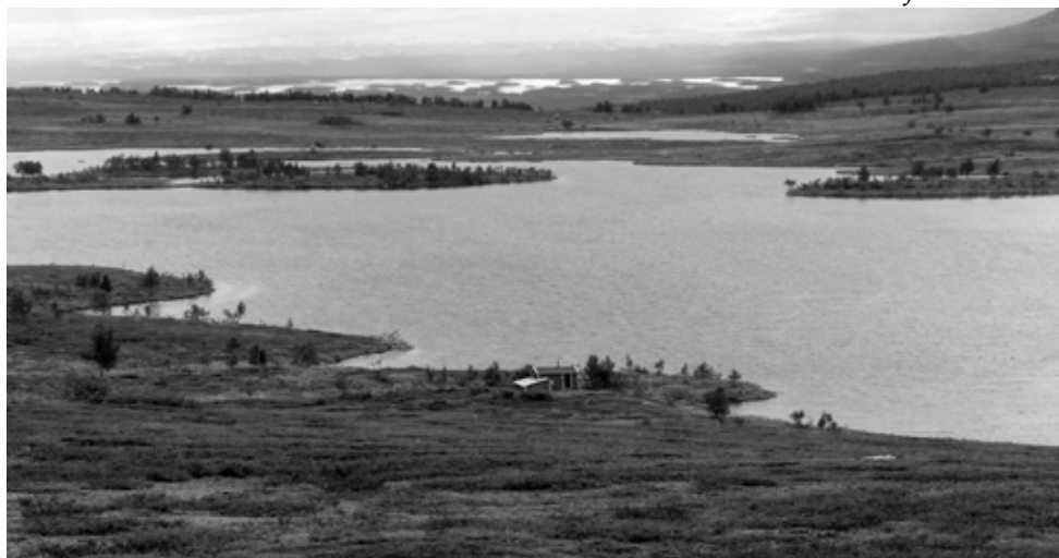
Staine-järven takana pilkottaa Tärnasjön eteläpää moreenisaarineen.

kurassa melkein polviin asti. Aurinkoisina päivinä maisemat Norjan tunteineen hivelivät silmiä, sateessa ja sumussa kulkiessa tuijotettiin tietysti kengänkärkiä.