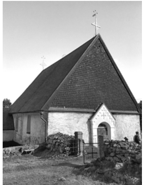
Pyhän Annan kirkko