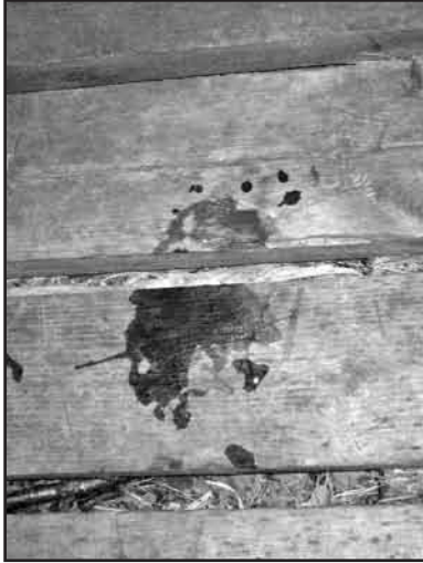
Karhun tassu Karjakaivon laiturilla

saariston lapsena, jonne fillaroitiin tai sitten joku (faija) heitti meidät perille saareen, jossa saatiin lämmittää sauna, (saunan ikkunasta oli upea näkymä merelle) ja käyttää yhteiskeittiötä muiden kanssa. Siellä kesäisillä rantakallioilla päivän paistattelun, uinnin ja veneilyn ohessa tutustuttiin muihin, jotka tänä päivänä ovat myös Lapinkävijöitä, jes.