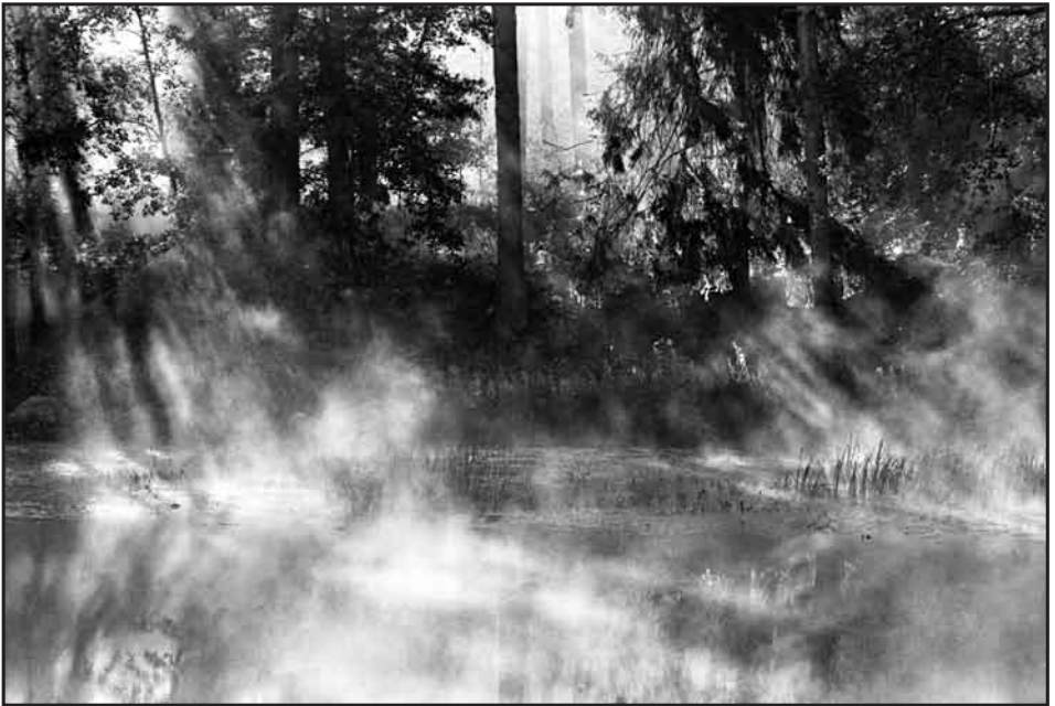
Mustionjoki, Karjaa, Ilford HPS, Polymeerigravyry 1995