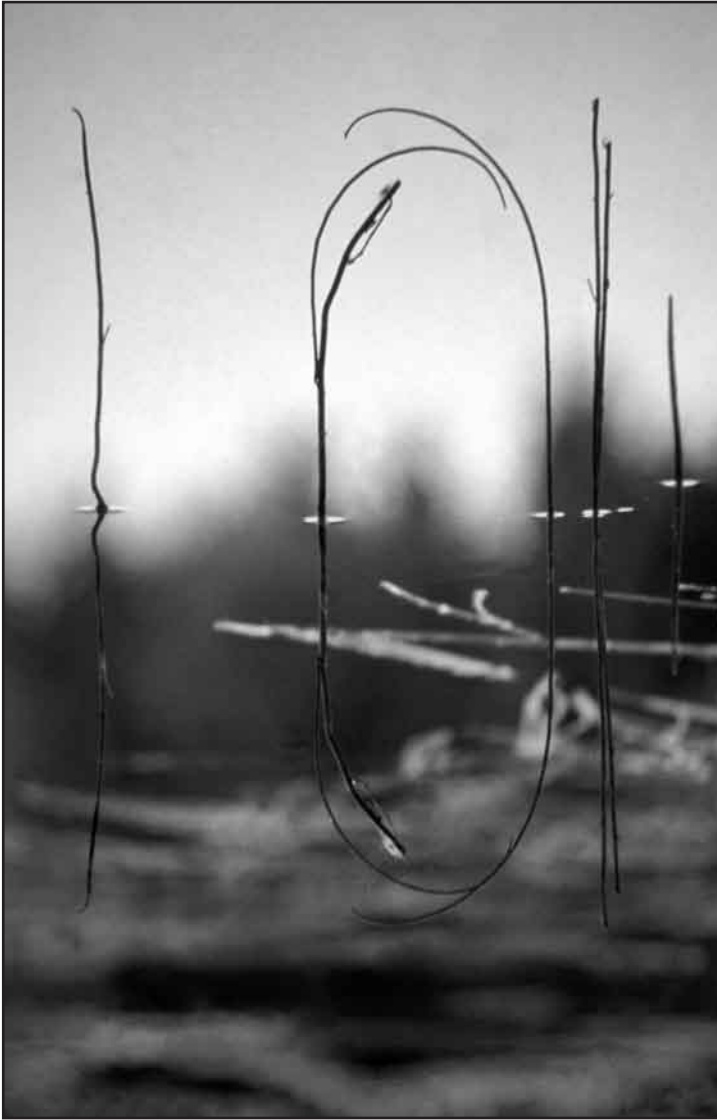
Saarilampi, Nuuksion kansallispuisto