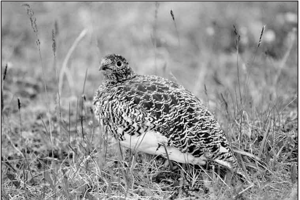
Riekkonaaras kesäpuvussa, Toskaljärvi