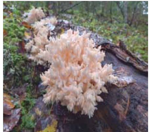
Koralliorakas Komion Mustinmäen harjulla.