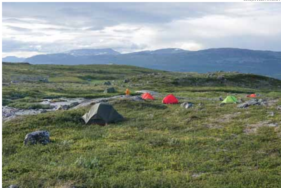
Leiri Guolbanjohkan varrella tunturissa.