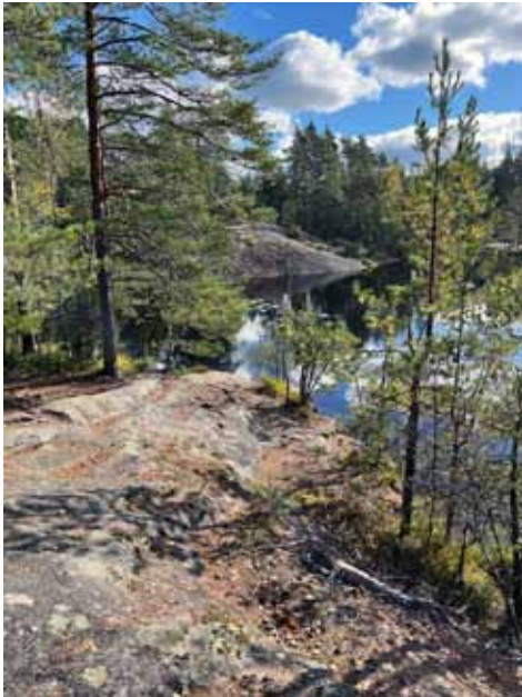
Saaren Mustan rauhaisia rantakallioita.