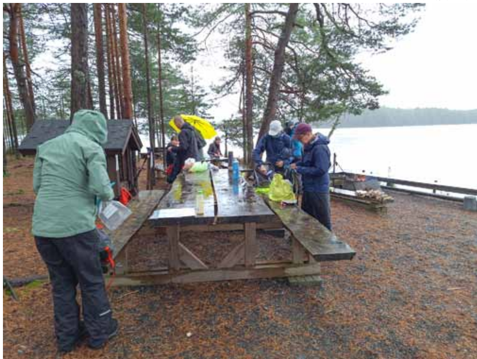
Sateisella Luutalammin esteettömällä nuotiopaikalla.