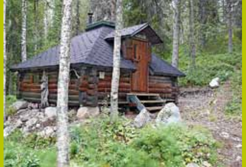
Goados WGS84 67° 42.679' 24° 19.823'