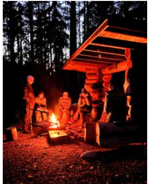
Laavuilta tähtitaivaan alla oli hieno kokemus.