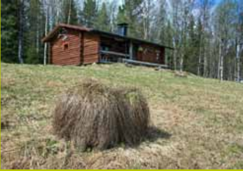
Kukasmaja WGS84 67° 42.708' 24° 19.830'