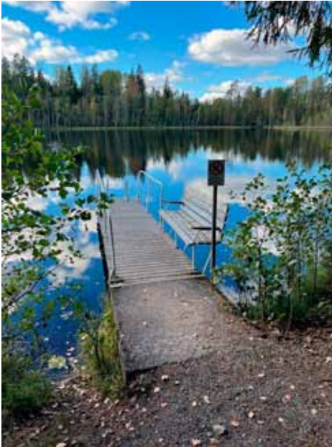
Laiturilta pääsee uimaan Majalammella.

Nuuksion järviylängön pohjoisosassa on joukko lampia, jotka syrjäisestä sijainnistaan johtuen ovat säilyneet melko koskemattomina. Majalammet muodostuvat kolmesta noin 71 metriä merenpinnan yläpuolella olevasta vesialueesta, Mylly–Majalampi, Vähä Majalampi ja Majalampi. Näistä vain