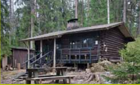
Karjakaivon alamaja WGS84 60° 17.911' 24° 35.090'