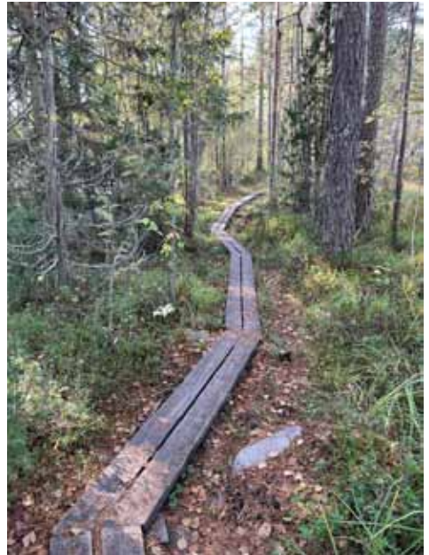
Kämmenlammelle tullaan pitkoksia pitkin.

Kävely alkaa pujahtamalla vesilaitoksen takaa Vihdin kunnan puolelle Majalammenpolulle, jota seurataan satakunta metriä pohjoiseen Majalampien laskupuron sillalle ja padolle.