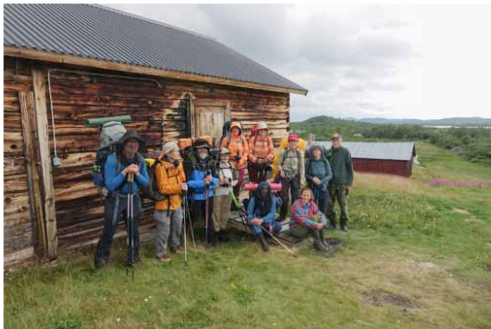
Vaeltajat ja Kummavuopion isäntäväki (oikealla) yhteiskuvassa.