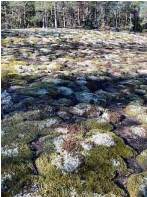
Valko-/viher-ruutuista silokalliokasvustoa Nuuksion ylängön huipulla.

nettä, mutta Kokkoissuon ylitys tehdään pitkosputse, ja pian ollaan Kämmenlammella, jossa laavu tuli-paikkoineen, puuliiteri ja uimalaituri. Kämmenlampi on peräti 93 metriä mpy oleva laskupuroton lampi. Kantattaa huolehtia, ettei lampeen mene ihmisen toiminnan takia ravinteita tai mitään saasteita. Laavun edessä oli ennen nuotion suojana tuulenestolevy, mutta ajan hammas on ruostutta-