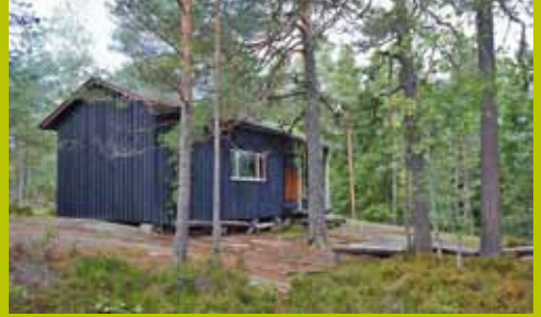
Karjakaivon ylämaja WGS84 60° 17.873' 24° 35.004'