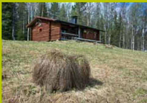
Kukasmaja WGS84 67° 42.708' 24° 19.830'