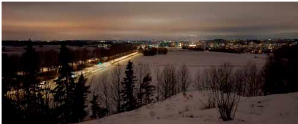
Näkymä Hallainvuoren kalliolta Viikin peltojen yli yliopiston kampukselle