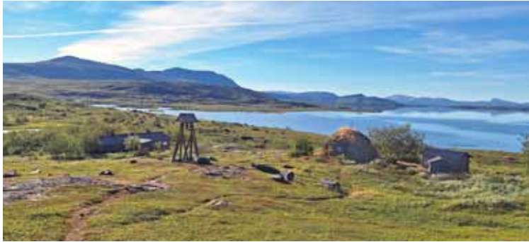
Tumman pitkänomaisen tunturituvan vieressä sijaitsee turvekammiin rakennettu tunnelmallinen kappeli.

Vaisaluoktassa. Välillä reitit eroavat toisistaan. Kun Kalottireitin läntinen haara Norjan Sulitjelman kylästä saavuttaa eteläisen haaran, Kalottireitti yhtyy taas Padjelantaledeniin Staloluoktassa. Staloluoktassa kohtaavat siis merkityt reitit idästä, lännestä ja pohjoisesta.