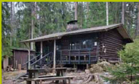
Karjakaivon alamaja WGS84 60° 17.911' 24° 35.090'