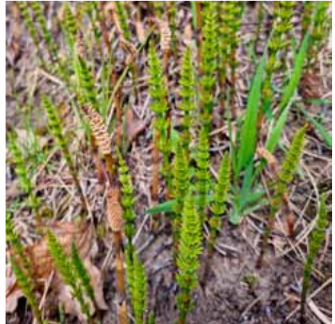
Haarattomia kevätversoja ja aluillaan olevia kesäversoja.

Peltokortte kasvattaa kaksi versoa: aikaisin keväällä itiötähkällisen kevät-