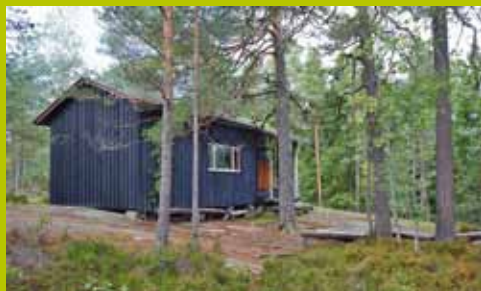
Karjakaivon ylämaja WGS84 60° 17.873' 24° 35.004'