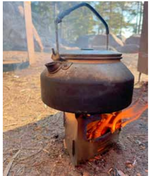
Kuvasta huomaa, että keittimen rakenne on avoin, joten tuulesta on haittaa ja kekäleet putoavat suoraan maahan.