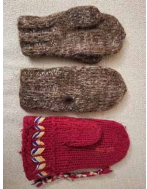
Ylimpänä islantilaiset kalastajan lapaset, alimpana paljon käytetty Lovikka-lapanen.