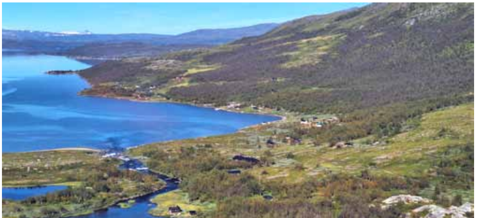
Staloluoktassa Duorponin saamelaiskylä levittäytyy tunturin juurella ja aivan kuvan alareunassa näkyy tunturituvan sauna.

Staloluokta on puiston keskuspaikka, jonne lennämme Kvikkjokkista helikop-