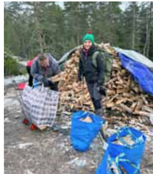
Puiden kuljettamiseen on monta tapaa