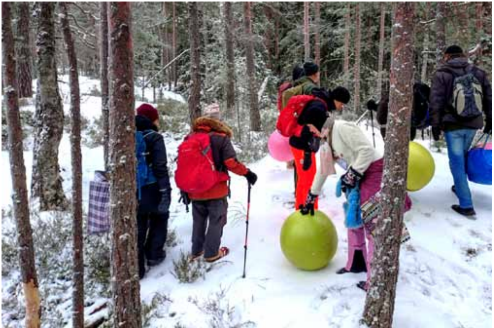
Ensimmäisenä vuorossa oleva pari määrittää aloituspaikan ja maalipallon paikan.