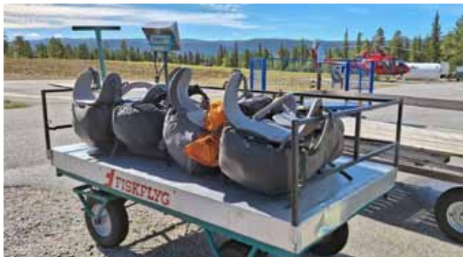
Helikopterilennolle lähtiessä rinkat punnitaan, sillä enimmäispaino on 20 kg.

Vuonna 1885 perustettu Svenska Turistföreningen (STF) merkitsi ensimmäisen vaellusreitinsä kaksi vuotta myöhemmin Kvikkjokkista kohti Sulitjelmaa, jonka silloin oletettiin olevan Ruotsin korkein tunturi. Vuonna 1888 polun varrelle rakennettiin ensimmäinen avoin tupa, Varvek stuga, joka valitettavasti paloi 2 000-luvulla. Kvikkjokkin tunturiasema, jonka STF perusti vuonna 1928, on yhä edelleen vilkkaassa käytössä. Tulevana kesänä siellä on niukasti toimintaa, sillä suurin