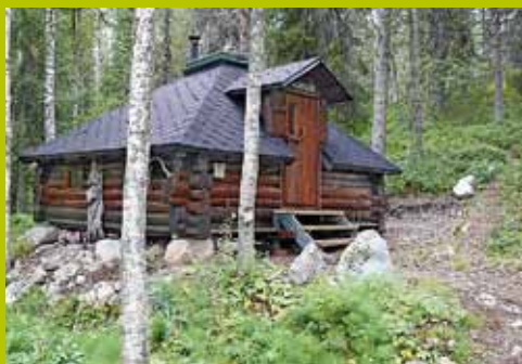
Goados WGS84 67° 42.679' 24° 19.823'